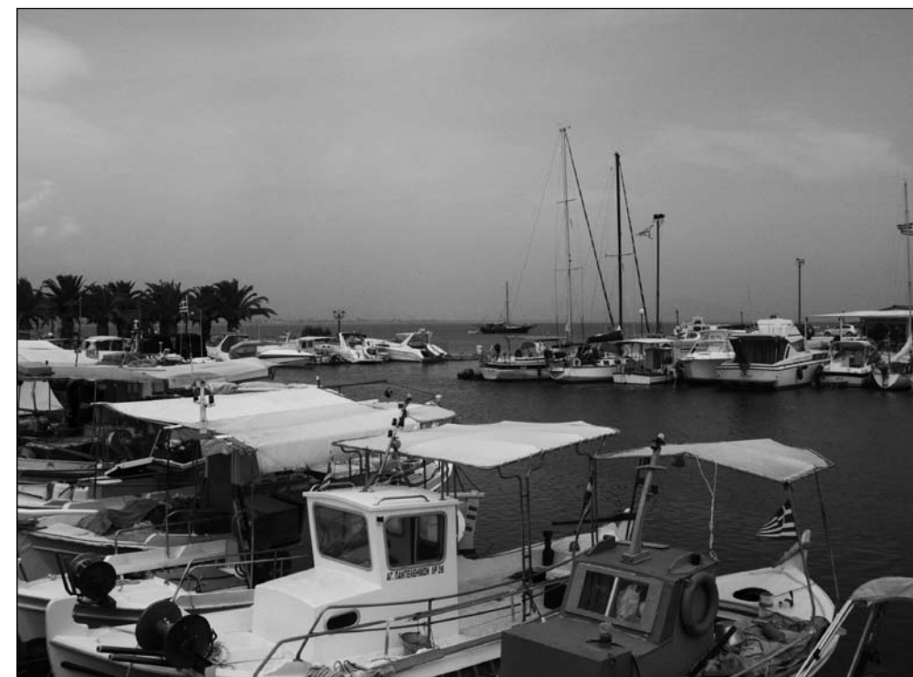
Nea Makri jest jednym z popularnych małych portów jachtowych na wschodnim wybrzeżu Attyki.