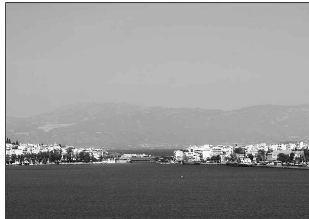
Most w Chalkis, widziany od południa.