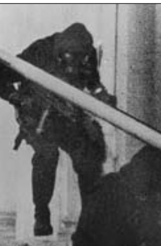
MP5 zdobyły medialną „sławę” po użyciu tej broni przez brytyjskie SAS podczas akcji uwalniania zakładników, przetrzymywanych w ambasadzie irańskiej w Londynie w 1980.

WARIANT POLICYJNY Spełniając wymagania amerykańskich służb policyjnych, w 1991 firma Heckler & Koch opracowała pm MP5 dostosowany do strzelania amunicją 10 mm Auto, a następnie wersje na amunicję .40 Smith & Wesson oraz .45 Colt. Pm MP5SF to karabinek samopowtarzalny, stanowiący popularną broń oddziałów antyterrorystycznych policji. Uzupełnia lub zastępuje term, większą donośnością i większym zapasem amunicji, ponadto z MP5SF łatwiej strzelać drobniejszym (w sensie budowy fizycznej) policjantom.